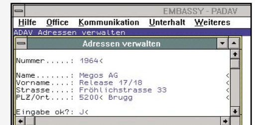
1992: EMBASSY auf Windows 3.1