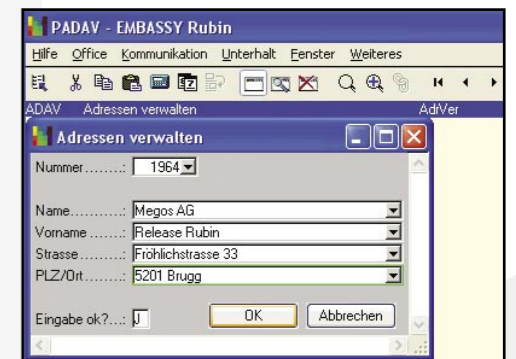
2004: EMBASSY auf Windows XP