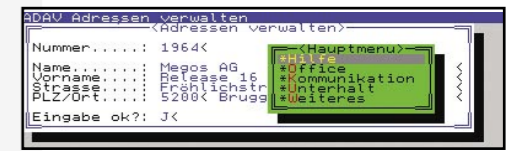
1990: EMBASSY auf OS/2 1.0