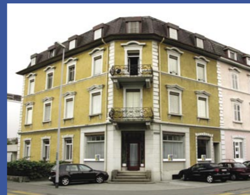
megos Fröhlichstr. 33